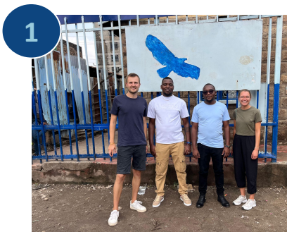
EFYE e.V.-Mitglied zu Besuch in Kenia

In diesem Newsletter blicken wir mit Euch auf einige Highlights des vergangenen Jahres zurück, teilen spannende Updates aus den letzten Monaten und geben einen kurzen Ausblick auf das, was uns 2025 erwartet. Eure Unterstützung war und ist ein entscheidender Beitrag dazu, dass wir diese Herausforderungen gemeinsam meistern konnten. Dafür sagen wir von Herzen Danke!